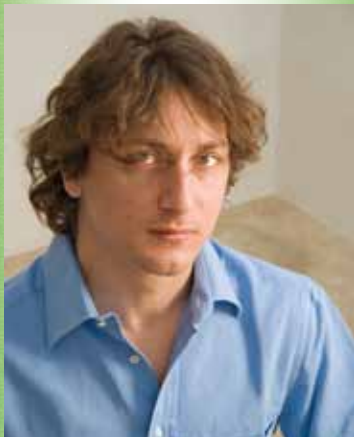
フランチェスコ・リベッタ (Francesco Libetta)